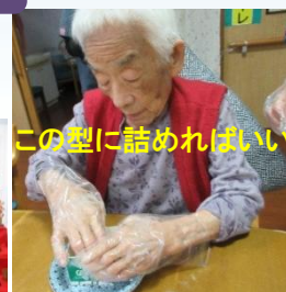
この型に詰めればいいが?