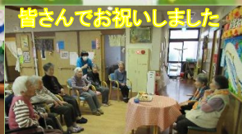
皆さんでお祝いしました