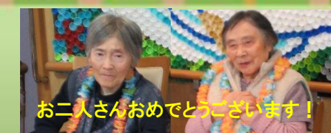
お二人さんおめでとうございます!