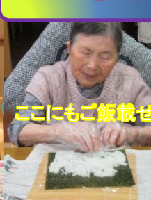
ここにもご飯載せて